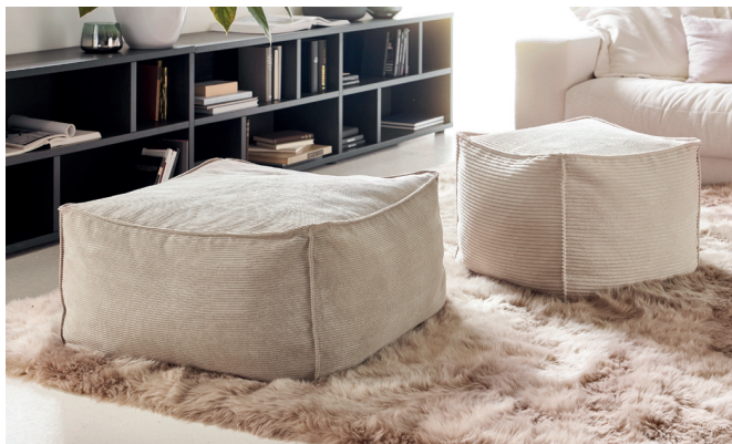
Hocker und Hocker medium