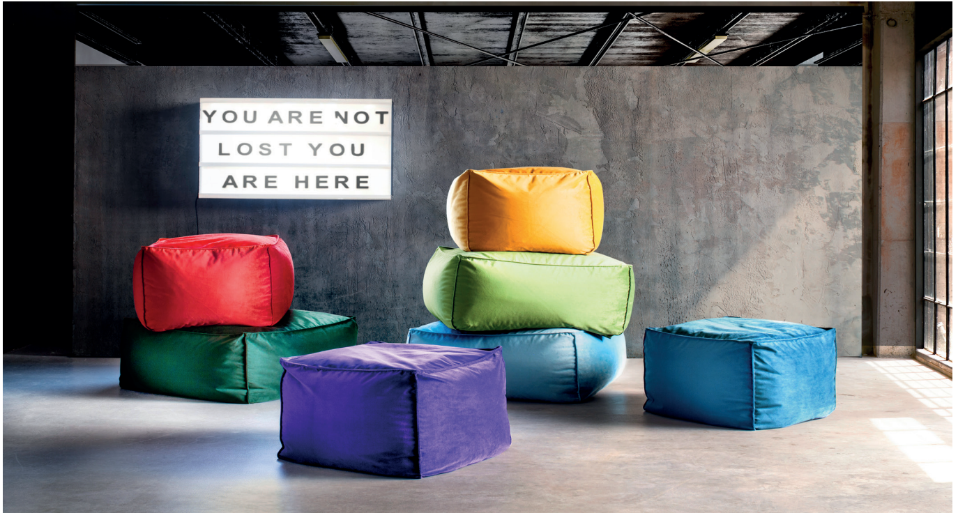
Hocker und Hocker medium